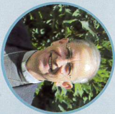
MONSEIGNEUR THIERRY SCHERRER Évêque de Laval