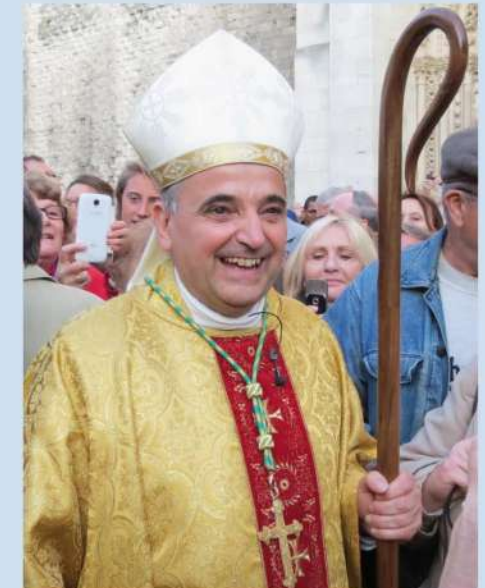
Mgr Dominique LEBRUN, archevêque de Rouen

L'eucharistie sera aussi célébrée dans l'église paroissiale, la chapelle des Oblats, la salle des loisirs et la salle Notre Dame. Retransmission sur grand écran en chaque lieu